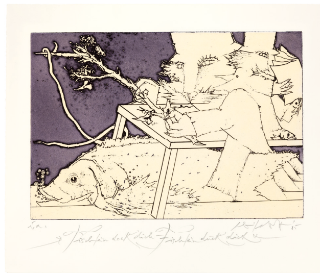
»Tischlein deck dich – Fischlein duck dich«